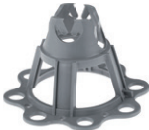
Abstandhalter „mit Grundplatte“